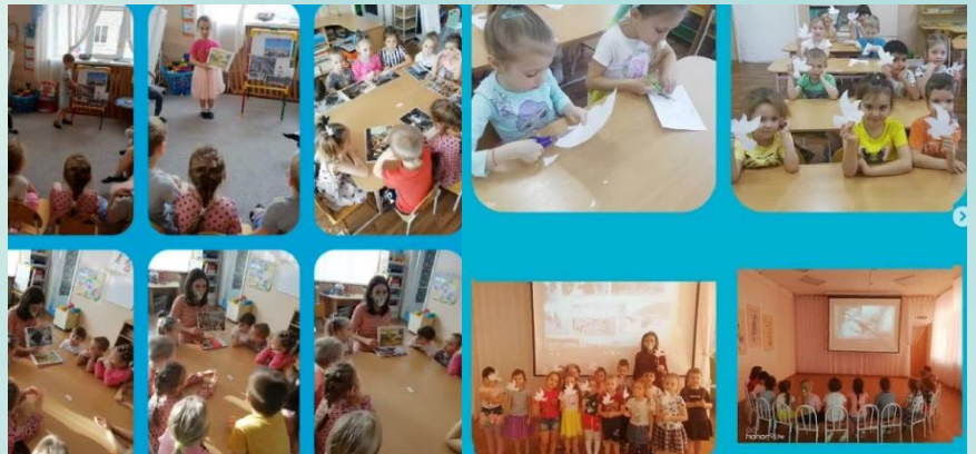
День снятия блокады города Ленинграда