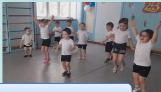
«День Защитника Отечества»