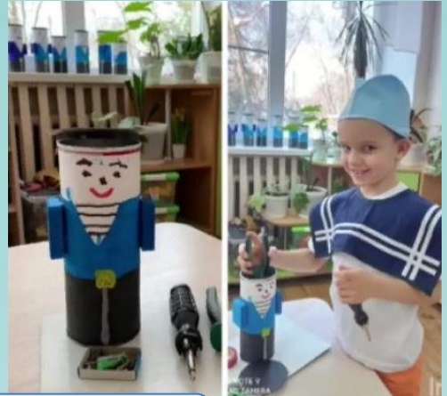
Акция: «Экоподарок Защитнику!»