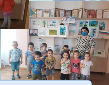
«Выставка ко Дню Защитника Отечества»