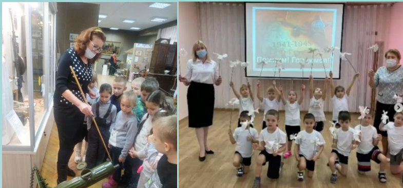
78-я годовщина со Дня освобождения Невинномыска