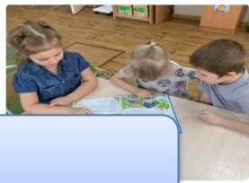
«День дарения книг»