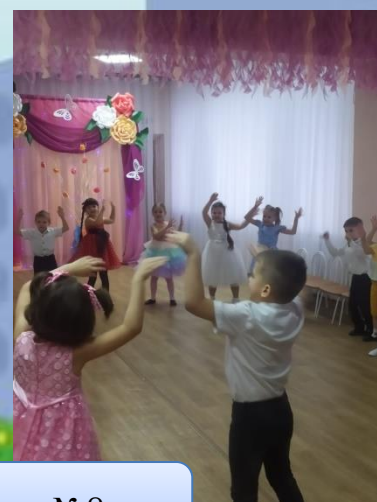
Старшая группа №8