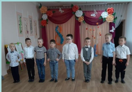
Подготовительная группа №11