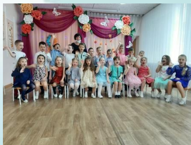
Подготовительная группа №10