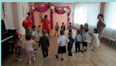
Младшая группа №1