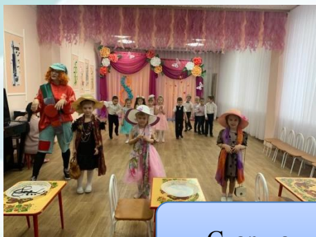
Старшая группа №2