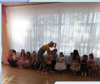
Средняя группа №7