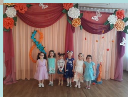
Средняя группа №6