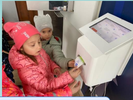
День почтовой открытки