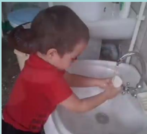
Всемирный день мытья рук