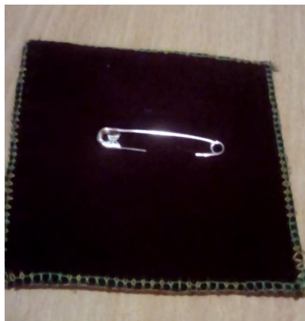
Фото 1, 2. «Фликер»

Фликер можно прикрепить к любой одежде, пришить к головному убору.