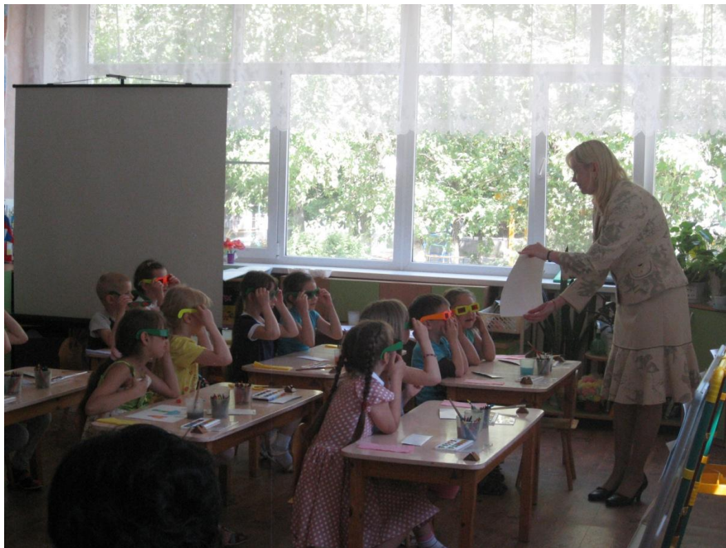
Фото 3. Демонстрация картин-анаглифов