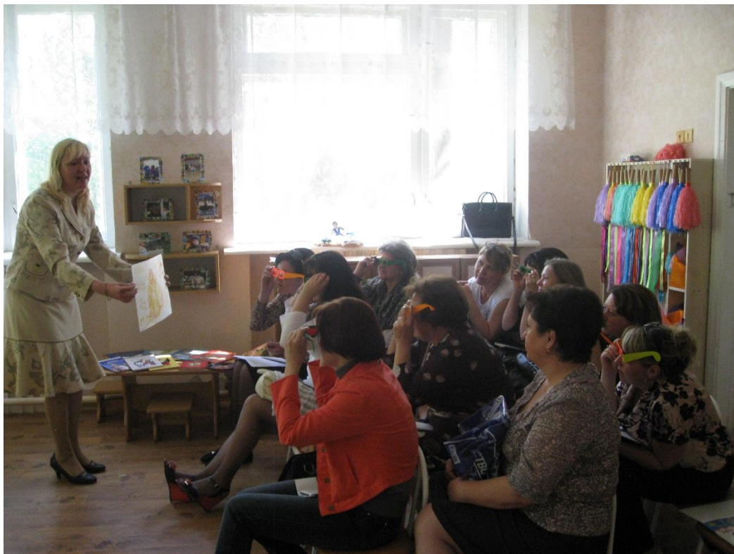
Фото 5. «Все мы родом из детства...»