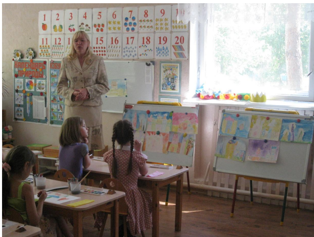
Фото 5. «Вот и город наш большой: Стены с частыми зубцами, И за белыми стенами Блещут маковки церквей И святых монастырей...»