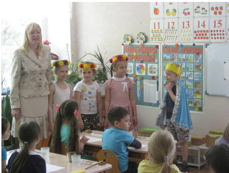
Фото 1. «Три девицы под окном Пряли поздно вечерком...»