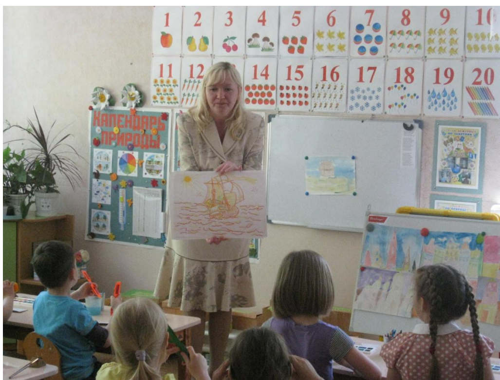
Фото 4. «Необыкновенные впечатления...»