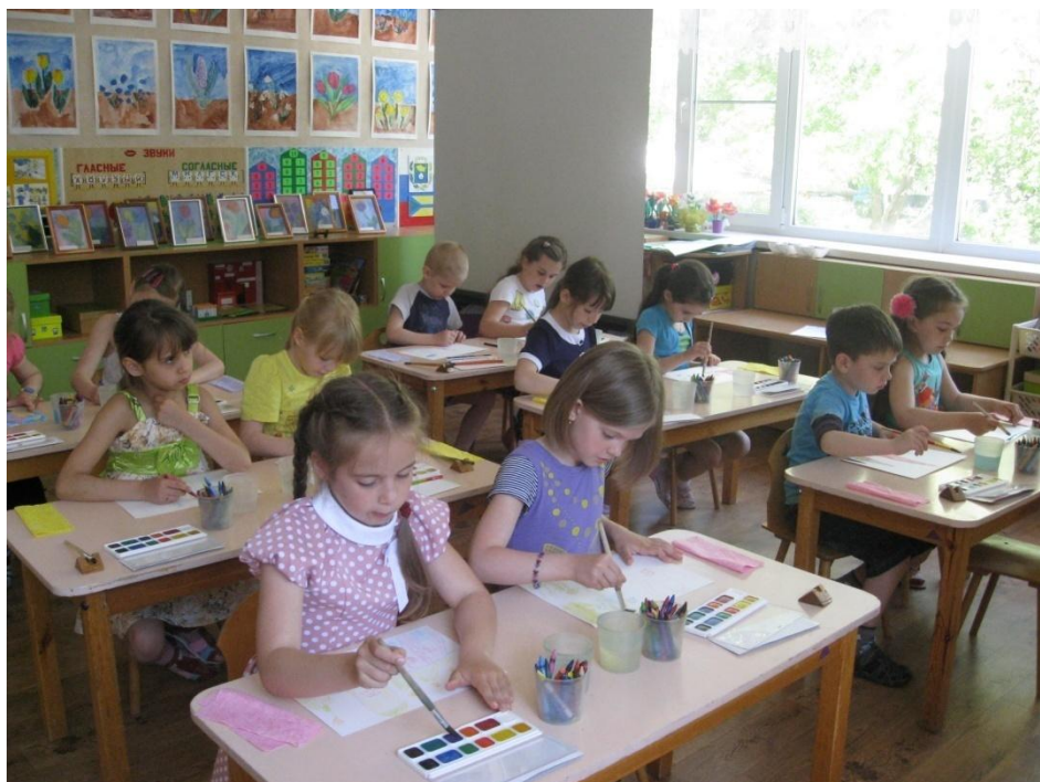
Фото 2. Создание композиции в нетрадиционной смешанной технике рисования (восковые карандаши и акварель)