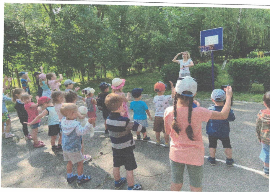
Утренняя зарядка (формирование первичных представлений о здоровом образе жизни)