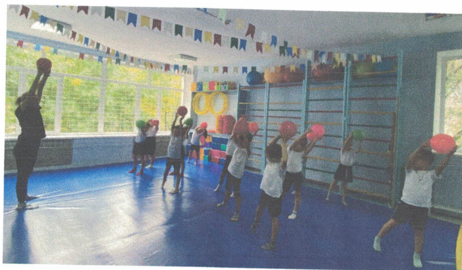
Формирование у детей потребности в двигательной активности и физическом совершенствовании