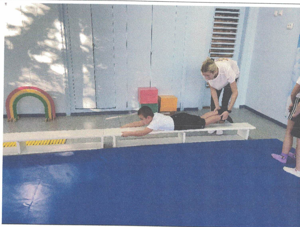
Развитие физических качеств